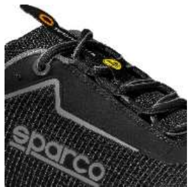
Etiqueta TEAMWORK en tejido jacquard en la lengüeta, Logotipo ESD en las trabillas de los cordones.