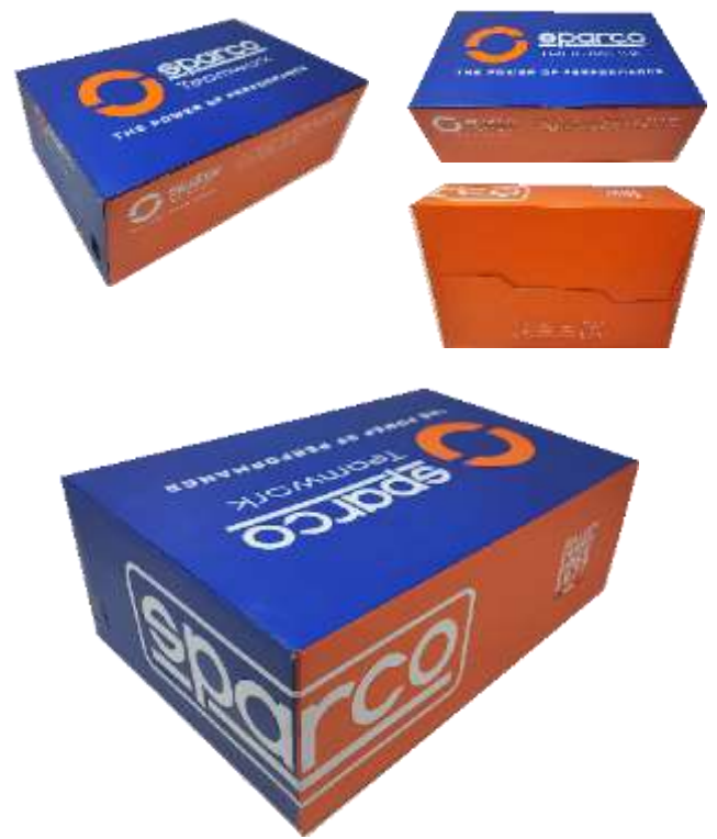
ZAPATERO SPARCO TEAMWORK BICOLOR en cartón Papel de seda interior azul-naranja y protector. Indicaciones de reciclaje válidas para ITALIA en la parte inferior (PAP20)