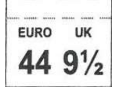
ETIQUETA DE TAMAÑO cosido entre la parte superior y la lengüeta Dim 17 x 14 mm