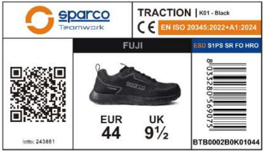
CAJA DE ETIQUETAS EXTERIOR aplicado en el lado preparado de la caja, muestra las características del producto, certificación, número de lote, código de producto, código QR y código de barras. Dimensiones: 105x60 mm