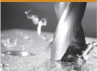
FRESAS DE PERFORACIÓN