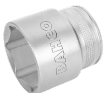
Vaso con cuadrado de 1/2" con perfil hexagonal de 20 mm y acabado pulido fino 7800SM-20