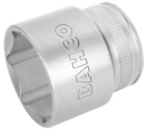
Vaso con cuadrado de 1/2" con perfil hexagonal de 24 mm y acabado pulido fino 7800SM-24