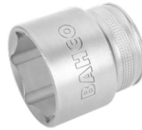
Vaso con cuadrado de 1/2" con perfil hexagonal de 32 mm y acabado pulido fino 7800SM-32