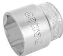
Vaso con cuadrado de 1/2" con perfil hexagonal de 13 mm y acabado pulido fino 7800SM-13