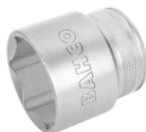
Vaso con cuadrado de 1/2" con perfil hexagonal de 17 mm y acabado pulido fino 7800SM-17