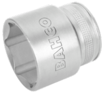
Vaso con cuadrado de 1/2" con perfil hexagonal de 30 mm y acabado pulido fino 7800SM-30