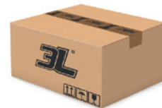
240 pares caja