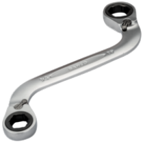
Llave doble de estrella plana a carraca en S de 14-19 mm con acabado cromado de 200 mm 1320SRM-14-19