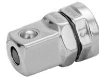
Adaptador para puntas y vasos con cuadradillo de 1/4" para llaves de carraca de 19 mm 1RMA-19-1/4-SQ